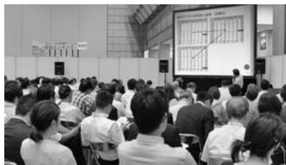
▲熱心に耳を傾ける聴講者