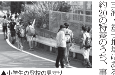
▲小学生の登校の見守り

また、業務の見える化をし、どの時間帯が忙しいのかを分析することで、そのスポットでパートを雇用するなどのメリットがある。